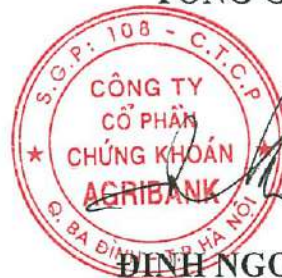
ĐINH NGỌC PHƯƠNG